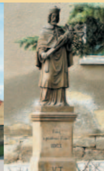
SV. JAN NEPOMUCKÝ HOŘEŠOVICÍCH