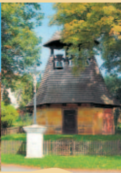
ZVONICE V NEPROBYLICÍCH