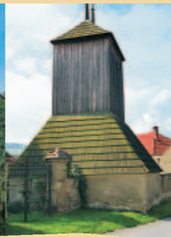
DŘEVĚNÁ ZVONICE V HOŘEŠOVICÍCH