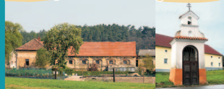
LOTOUŠ - KAPLIČKA