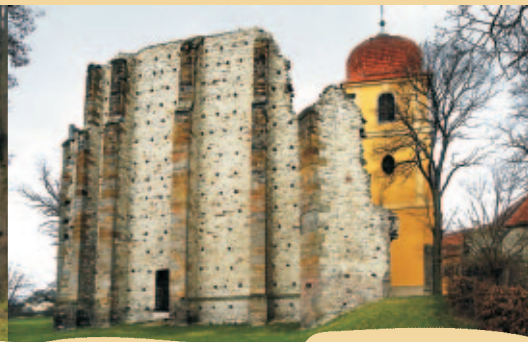
NEDOSTAVĚNÝ CHRÁM V PENENSKÉM TÝNCI