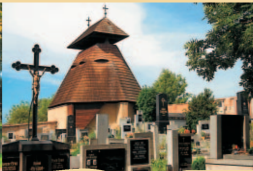
DŘEVĚNÁ ZVONICE VE KVÍLICÍCH