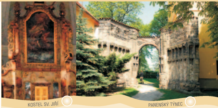
KOSTEL SV. JIŘÍ