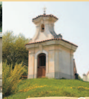
KAPLE SV. MARTINA V HOŘEŠOVICÍCH