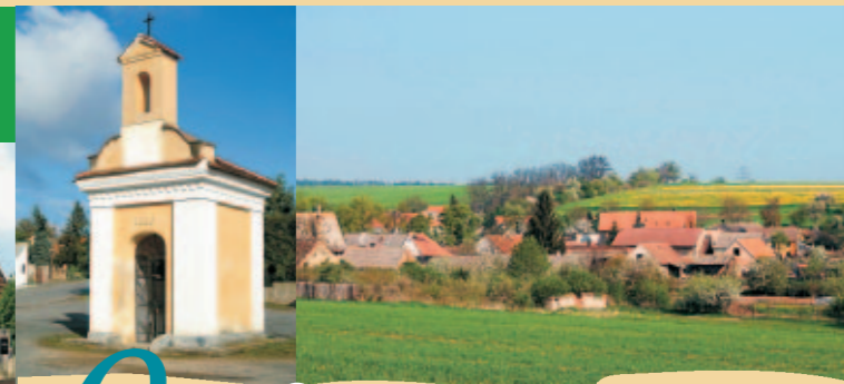
BYSEŇ - KAPLIČKA A POHLED NA OBEC

SLANÝ BYSEŇ LOTOUŠ NEPROBYLICE KUTROVICE KVÍLICE TŘEBÍZ HOŘEŠOVICE HOŘEŠOVIČKY ZICHOVEC ŽEROTÍN PANENSKÝ TÝNEC