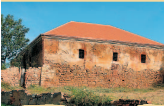
TVRZ V NEPROBYLICÍCH